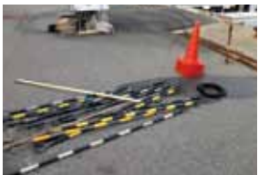
被害を受けたカラーコーン