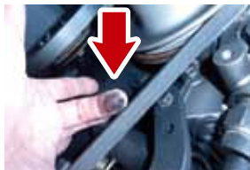
ベルト交換の目安です