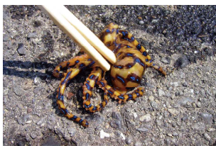
秋谷で見つかったヒョウモンダコ