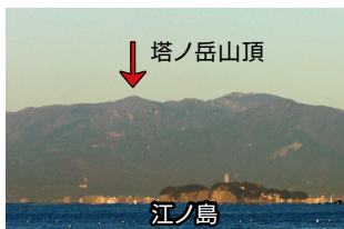
山頂小屋が見えますか