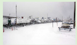
路肩が判りません