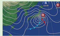
大雪を降らせた気圧配置

2月8日(土)・2月14日(金)には関東南岸を発達した低気圧が通過し、首都圏は2週連続で大雪に見舞われました。秋谷漁港でも過去経験が無いほどの積雪となったため漁港門を閉門して立入り制限を行いました。暴風にあおられ横殴りの降りっぷりは正に猛吹雪といった状態で路肩が判らなくなるほどでした。3月以降も大雪の可能性はありますので十分にご注意ください。