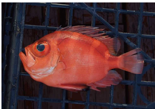
大きな目が特徴のクルマダイ