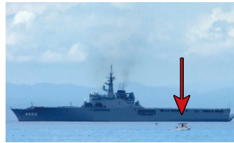
海自輸送船おおすみと同型船 矢印は7mのプレジャーボート

どんなに自分に正当性があっても、小さなプレジャーボートで事故を起こせば自分やゲストの命にかかわる問題となります。あらためて見張り十分・安全速力・右側通行・出船優先を心掛け、そして必ずライフジャケットを着用し、楽しいマリンライフを過ごしましょう。