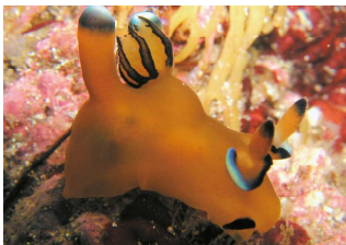
オレンジ色の可愛いウミウシ