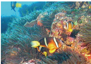
イソギンチャクに住みつきます