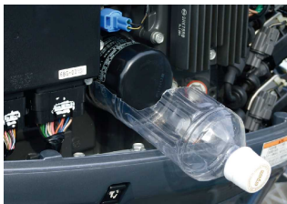
エレメント外しに便利なペットボトル