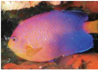
温帯種のレンテンヤッコ