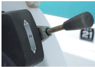
スロットルレバーのN位置確認