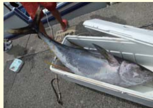
50kgを超えるキハダマグロ