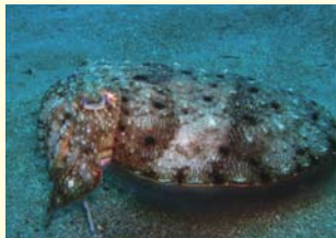
砂地水底を好むコウイカ