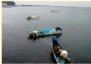
冬の名物“ワカメ切り”