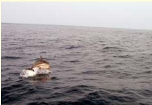
目の前をジャンプ!