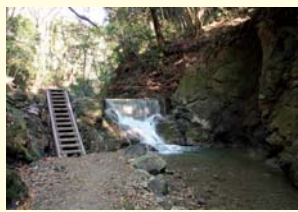
遊歩道が整備されています