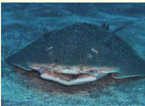
エイのようなカサザメ