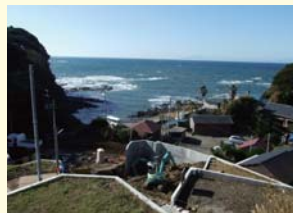
窯所だった秋谷乗越遺跡