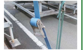
定期給脂と点検を

艇の固定方法ですが最近ではラッシングベルトをずいぶん見かけるようになりました。ロックも解除もワンタッチでとても簡単なので人気ですね。強度もそここのロープよりは高く感じます。ただし幅25ミリのベルトに関しては厚みがあるものをご使用ください。金具部分がステンレス製のものなら申し分ありませんがメッキタイプでもOK、ただし定期的にグリスやシリコンスプレーなどサビ対策を行わないと可動せずロックも解除もできなくなり何のためのワンタッチベルトかわからなくなります。また長さが限られているので応用が効かないのが少々難点。ロープは長さが自分好みにでき応用が効くのがいいですね。