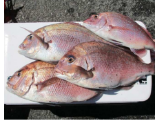
めでタイめでタイ