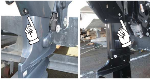
オイルドレンの位置 ヤマハ(左)とスズキ

車ももちろんですが、船を所有されている皆様はオイル交換という作業をされていると思います。ご自分で行くか業者さんに依頼するかはその方次第ですが、エンジンにしるギアにしるオイル交換が必要なのは皆さんご存じのはず。ところでオイル交換は何故必要なのか、交換しないとどうなるのか、じっくりと考えたことはありますか？オイルには大きく分けて5つの役割があります。まずは①潤滑作用。金属どうしがこすれあうエンジンやギアは摩擦による消耗を防ぐため潤滑機能は不可欠です。エンジンの仕様にもよりますが、適度な粘性が必要で、やわらかすぎれば摩擦が進んでしまし、硬すぎれば抵抗になってエンジン性能を充分発揮できなくなり、そして高温にさらされた状態でも低温の状態でも安定して潤滑できることが必要になります。②密閉作用。ピストンとシリンダーの間はピストンリングで密閉されますが完全ではありません。これを補うため(密着させるため)オイルで隙間を埋め、燃焼で得られたエネルギーのロスを防ぎます。③洗浄作用または清浄分散作用。燃焼時にカーボンスラッジという燃えカスが発生しオイルに溶け込みます。摩擦による金属粉も含まれるのでオイルが汚れてきます。これが蓄積されるとオイル本来の性能を発揮できなくなります。④冷却作用。燃焼により発生する高熱を吸収しエンジン内を安定させる役割です。⑤防錆、酸化防止作用。金属の表面を保護し寿命を守る役割です。この5つの作用のどれが欠けても、エンジンは本来の性能を発揮できないばかりか、寿命を著しく縮めることにもなりかねません。使用期間が長ければ汚れるし粘性は変化するし、オイル内に発生した不純物が抵抗を生み、エネルギーロスが増加します。使用しなくても空気に触れている以上酸化によって劣化します。したがって一定の距離あるいは使用時間ごとにオイル交換を行うことが必要になります。少なくとも半年に1回、乗らない方でも年に1回は交換すべきでしょう。そして適量を保つこと。少なくとも多くてもダメです。特に多すぎはエンジン内の内圧と抵抗が増すばかりか、オイルシールを傷める恐れがあるので要注意です。使用するオイルの種類や粘度はマニュアルや取説を見て適切なものをご使用ください。さあ今週末あたりいかがですか？