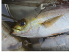
イサキが成長してます