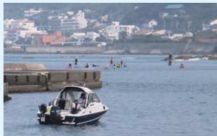
港口も十分な注意を

SUP の遭難が頻発しています。高い浮力とお手軽さが人気を集めて利用者が急増した結果でしょうか。港口などの事故を懸念して施設でも注意喚起していますが、これからは北風の季節なので、沖に流れ戻れないケースの急増が予想されます。出船艇ご利用者におかれましては、万一遭難 SUP を目撃した場合は、118 番通報とできれば救助をお願い致します。洋上の休日をご過ごす者同士、笑顔で帰路に就きたいですね。