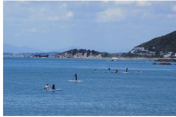
8月の秋谷海岸は危険があちこちに

夏本番ともなると秋谷海岸はにわかには賑やかになります。特に最近では様々なウォーターレジャーアイテムが充実し、ありとあらゆる形で海面や海中で遊ぶ人が増えました。気になるのがプレイスタイルによって移動する速度に差がありすぎる事です。車で道路を走っている時でさえ、脇をすり抜けるバイクや逆に30キロで走る原付スクーター、ふらつく自転車や歩行者などに細心の注意を払って運転しなければなりません。これが海に至っては同じ目の高さの海面対象物だけでなく、海中に潜んでいる岩礁やダイバー?にも注意しなければならないので、車の数倍の集中力を必要とします。特に海岸付近では浮輪でのんびり漂う遊泳者やスノーケラーの直近をめちゃスピードの出る水上バイクが通過したり、かと思えば船が頻りに往来する漁港の出入口にカヤックやSUPがたたずんでいたり、あげくの果てには停泊して釣りをしていたりという、とてもおそろしいシーンを目撃することがしばしばあります。秋谷漁港は秋谷海岸に隣接しており、人出で賑わう夏休み中はこのような光景が当たり前のように繰り広げられるため、漁師さんたちはできる限り徐行をして危険回避を心がけられますが、遊泳者の方はどこ吹く風で、自らの危険に気付いていないようです。漁港と海岸を隔てるブイがあっても平然とかいくぐって泳いでいるのが現状です。私たち船舶施設の職員が気付いた時には港内放送で移動を呼びかけますが、完全策ではありません。実は過去に筆者の友人が遊泳中に漁船のスクリューに巻かれ、足を切断するという事故をおこしています。幸い足はつながり現在は不自由なく過ごせておりますが、一歩間違えば命を落とすところでした。その時の様子を当人に伺ったところ、「泳いでいたら知らないうちに漁船が近づいていた。こちらに気付いていないようだったので、船底を蹴り潜ってやり過ごそうとしたら足が滑ってスクリューに巻き込まれた。」とのことでした。同じフィールドで過ごすには無理がありすぎる船舶と遊泳者、カヤック、SUP、そして水上バイク、、、艇ご利用者の皆様におかれましては、楽しいはずの海の休日が事故に巻き込まれて暗転してしまったなどということのないように、港内徐行と充分な見張りのもと、お出かけして頂きたいと思っております。特に帰港時の防波堤の影など死角に危険が潜んでいるかも知れません。楽しい休日を楽しいまま終わらせてください。