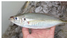
アジ。根付き型でしょうか

夏らしく夏の魚が釣れています。夏といえばシイラ。好みは分かれますが、味は抜群です。アニサキスが気になるところですが、刺身で食べたいですね。ほんのり甘みがあって実においしい魚です。そして夏はアジ。イサキも夏の魚ですね。晩酌のお供にサイコウです。今夏はブリが釣れています。思ったより太っていて刺身や照焼きにいいですね。伝説のシロアマは運を使い果たしても食べたい魚です。