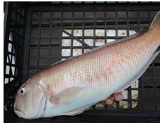
運命を握る？シロアマ