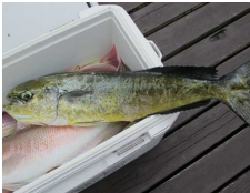
シイラの季節になりました