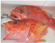
赤いカサゴは美味？