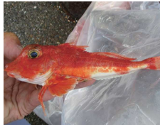
カナドはホウボウの仲間