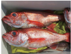
アカムツ大きかったです