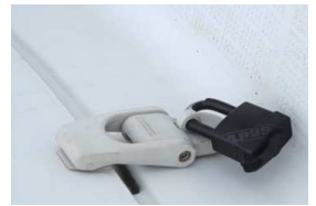
施錠をお忘れなく

「密」を避けて楽しめる釣り人気が高まる中、釣具の窃盗事件が相次いでいます。店舗では万引きが急増し、ある釣具店ではコロナ拡大後に売上も増えたが万引き被害も5倍ほどに増えたとのこと。車や船からもちろん盗まれており、盗品はネット販売されているものと見られます。盗まれないように保管するのは当然ですが、万一を考え型番や品番を控えておいたり画像を残しておき、被害が判明したらすぐに盗難届をだしましょう。当施設でも過去に船の収納庫から釣具等が被害を受けているので、施錠はもちろんですが、大切なものは艇に置かず、ご自宅にお持ち帰りをお願いいたします。