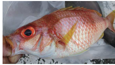
イトヨリ科のタマガシラ

赤い魚が多かったですね。アカムツは漁師さんの釣果ですが1.3キロ！とビッグでした。赤いカサゴは深場のユメとアヤマでどちらも美味。ホウボウに似ているのはカナド。シマ模様が目印のタマガシラ。ペラ科のテンスはイラに似ていますが、身体の模様と尾びれの形状で見分けがつかます。味はテンスに軍配でしょうか？