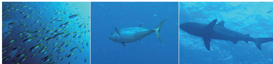
魚の群れはハンパなし

ラインナップとしては大カンパチ、アオダイ、キハダ、シマアジ、マダイ、ヒラマサなどなど、どれもサイズがでかいので、思う存分ファイトができ、至福の時間を過ごすことができるでしょう。過去にはダイビングのエキスパートたちがはるばる遠征してドリフトダイビングを楽しんだようですが、あまりに潮が速過ぎて流されてしまう危険性が伴うため、かなりの経験者でないと潜れません。何より1年の内で銭洲までたどり着ける海況に恵まれることは少なく、計画しても実行が極めて難しい海域として、ほとんど開催されることが無くなったようです。余談ですが潜った方に話を聞いたところ、エントリー直後から3メートルを超えるメジロザメが回りを、泡を吐きながら進むダイバーたちを興味深そうに伺っていたとのこと。おそらく船のエンジン音が聞こえると「釣船=エサにありつける」と近寄ってくるらしく、サメも学習しているのでは、ということでした。プレジャーボートでは到底たどり着けないエリアなので、神津島からアプローチするか、西伊豆のツアー船を探しあてるか、チャーター船で行くしかありませんが、一度は訪れてみたいアングラーあこがれのポイントです。エッ?もう行かれました?