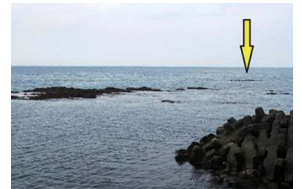
平島の沖にも岩礁地帯

干満の差が大きい時期です。暗岩礁や沿岸部には特に注意が必要ですが、秋谷港駐車場からほど近いところに漁師さん呼ぶところの“平島”という岩礁があります。干潮時間帯には海面から根が現れますが、さらに沖側に“沖の平島”というもう一つの根があり、この期限定で現れます。平島は皆さん普段から認識されていて近寄ることはありませんが、沖の平島はその存在があまり知られていないため、見落とされがちです。普段はめったに通るルートではありませんが、万が一お隣のサニーサイドマリナーに行かれるご用の方は要注意です。面倒でも沖側から正規のルートでアプローチしてください。