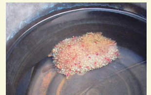
カラフルな大型ウミウシ

【ハナデンシャ】魚ではなくウミウシ(巻貝の仲間が変化した)です。身体に多数の突起と赤や黄、オレンジの鮮やかな模様があります。漢字で「花電車」、路面電車が全盛の時代に祭事で花飾りや電飾を施した車輛を連想させる華やかな色合いから、この名がついたそうです。ウミウシの中では大型で15センチほどになり、泳ぐというか海中を浮遊して移動し、クモヒトデなどを捕食するアクティブなヤツなんです。