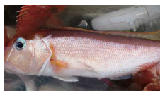
なんと！キアマダイ

アマダイの中でもかなりレアなキアマダイが釣れました。目の下の白線がその証しです。深場といえばアカムツ（クチグロ）。そしてアカムツ同様に口の中が黒いユメカサゴ。さらに深海系のカゴカマス。深場が充実していますが、浅場も負けていません。シロギスが確実に大きくなって食べ頃サイズです。あたたかな季節と相まってのんびりできますよ。