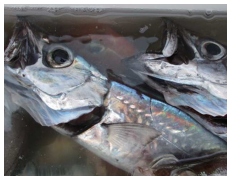
歯がすどいカゴカマス