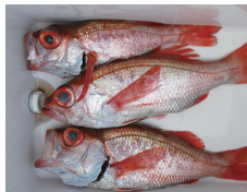
赤いスーパースター