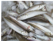
シロギス順調です