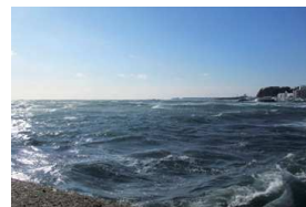
冷静な判断をお願いします

4月に知床半島で観光船が沈没するというショッキングな事故が起きました。当時は風波が強し漁師さんも出漁を見合わせるほどの海況だったのですが、出船を中止する判断が下されなかったことが残念でなりません。観光に訪れた一般客が天候や海況について運営者に意見を言うとは考えられず、不安な気持ちがあってもなすすべが無かったと思います。私たちも海のレジャーに係る者として、他人事とは思えず、保管艇の出船に関しては、できる限り情報をお伝えし、事故防止に役立てると共に、ダメな時は潔く取りやめて頂きたいと思っております。お亡くなりになられた方々のご冥福をお祈り申し上げます。