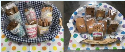
食べきりサイズです おやつにいかがですか？

船舶事務所内でクッキー販売を始めました。なんと手作りクッキーです。横須賀市の地域作業所「どすこい横須賀」の皆さんに作って頂きました。ゆず風味やコーヒー、黒糖、きなこなど種類も豊富で1袋200円と、とってもリーズナブルです。釣行最中のお茶請けに、小腹がすいた時に、お家のお土産にぜひ。クッキーを食べるほのぼのした気持ちになれば魚も釣れる？