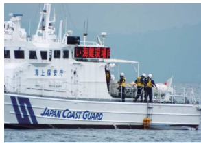
ときどき秋谷沖にやってきます

夏が近づけば海にくり出す人が増えます。当然、事故やトラブルのリスクも高まり、事故が起きれば警察や消防が出動します。しかし現場が海の上だったら、パトカーも救急車も近づくことはできません。110番と119番はみんな知ってる緊急通報の番号です。しかし「海のもしも＝海上保安庁の118番」を知らない人が圧倒的に多いことは以前の秋スポでも取り上げました。海保によれば90%以上が間違い電話とか有効ではない通報だとか。洋上や港湾で働く人や海上のレジャーを楽しむ人にとっては「118番」は海保へのホットラインと認識していますが、それ以外の人から見れば沿岸の水の事故だったら「110番」か「119番」に通報してしまうでしょう。だから「118番」を知らなくても仕方ないのかも知れません。先日見たテレビの番組で海上保安官が「118番を浸透させるには“い・い・や”で覚えるといいですね。」とのコメントをされていました。少しでも間違い電話をなくすことで肝心の緊急通報への影響を防ぎたい、という気持ちの表れだと思います。当施設でも秋スポ161号で「118いいやと188いやや」というタイトルで通報のかけ間違いを防止しようと呼びかけたことがあります。188番というのは消費者ホットラインの番号で消費トラブルに関する相談の窓口です。しかし「118いいや」は海上緊急通報をイメージしにくく、やはり認知度を上げるにはもう一つといった感があります。そこで考えたのが「海保の海猿は人命救助に全力を尽くすいいヤツ」ということで“いいやつ(118)”と覚えるのはいかがでしょうか。海保＝海猿のイメージは定着しているので、“いいや”よりもピンとくると思います。これが全国的に普及するとは思えませんが、私たち秋谷にかかわるボーター間の中だけでも合言葉になればいいですね。エンジントラブル等で緊急性の無い案件ならばBANへの救助要請がベストと思われませんが、人命に関わったり、一刻を争うような案件ならば、海保への救助要請が必要になります。現在、秋谷に近い海保の基地は江ノ島と田浦港にあります。秋谷沖でSOSをした場合、救助船の到着は最短でも30分以上かかるので、それまでは自分の力で踏ん張るしかありませんが、万が一のピンチの時には、“いいヤツ”がきくと助けに来てくれることでしょう。