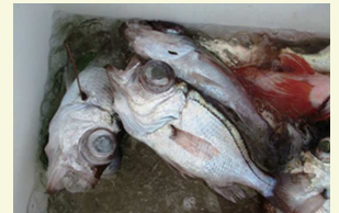
シロムツは釣魚用語です

釣モノでムツといえばアカムツ、シロムツ、クロムツですね。皆同じ種に属しているのかというと実は違うのです。クロムツはムツ科に属しますが、アカムツとシロムツはホタルジャコ科に属します。さらにシロムツは標準名ではなくオオメハタあるいはワキヤハタという名前が付いているんです。そしてハタの名が付くのにハタ科ではないという何ともややこしいネーミングです。でも食べて美味しければ名前は問題ないでしょう。