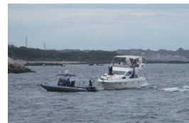
休日を無駄にしないためにも

先日、出船艇がエンジントラブルに見舞われました。出港して間もなくエンストしたため、直ちにアンカリングされ原因究明にあたったところ、燃料の供給に不具合が発見され、対処されたのち無事帰港されました。ちょっとしたトラブルで航行できなくなると、せっかくの休日が残念なことになるばかりか、場合によっては命の危険にさらされることもあります。あたり前の話ですが出港前点検というのはこういったトラブルを防ぐのにとっても大切です。海を前に早く釣行に取り掛かりたいと思う気持はよくわかりますが、ほんの10分間だけ点検に時間を割いて頂ければ、トラブルで貴重なひとときを無駄にしないで済みます。ほんの10分間です。