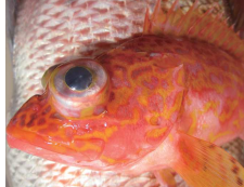
深場のアヤマカサゴ