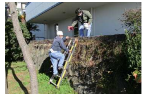
避難ルートの確認を

3月16日深夜に大きな地震が起きました。震源地は福島県沖でマグニチュード7.3、震度6強と、11年前の震災を思わせる地震でした。就寝時だったので地元の方はさぞかし怖い思いをされたことでしょう。18日深夜にも岩手で震度5強を観測する地震があり、あらためて地震津波に対する備えと心構えが必要と感じました。秋谷漁港は海拔1.9mなので、大潮の満潮時に冠水することもあり、津波や高潮が発生したら避難が必要な場所です。船舶施設では突然の災害時にも速やかに行動できるように避難ルートの点検や定期訓練を行っています。ご利用者の皆様も一度ルートの確認をお願い致します。