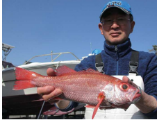
満足の釣果でした