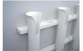
定期点検をしましょう

これからの時期は紫外線が強くなりプラスチック製品には厳しい環境になります。舷やキャビンサイドに取り付けられたロッドホルダーは大丈夫でしょうか。ステンレス製タイプは心配ありませんが、プラスチック製のは劣化が進み脆くなっているのが割れやすく、破片で手を怪我したり繊維が刺さったりする可能性があります。また安易に釣竿を立てておくとホルダーが壊れた時に竿が海中に落下する危険性も。一度点検をされ不安があるものは交換しましょう。海外製品はネジのピッチやレンチ径が異なるので注意が必要です。該当する工具が無い時はご相談ください。