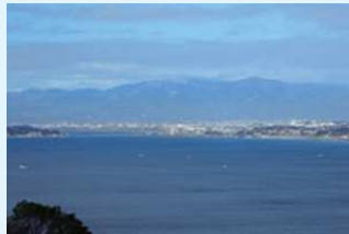
相模湾が望めます

新緑の季節です。お弁当を持ってハイキングはいかがでしょうか。大楠山もいいですが、おススメは葉山三ヶ岡緑地。葉山公園駐車場を利用して森戸海岸までのトレッキング。旧役場前からアプローチし、新緑や山花草をかなでながら一汗かくと富士山や江ノ島のパノラマが広がる休憩所に着きます。潮風を感じながら海岸まで下りたら、海沿いに歩くもよし、バスで戻るもよし。途中で海鮮ランチやコロケの評判店あります。