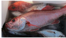
アカムツ好調です

アオモノは今一つですが、ソコモノは好釣、ムツはアカ、クロ、シロと釣れています。最近の当施設ではほとんど釣果の無かったメバルが釣れました。煮付けがサイコウでしょうか。大きければ刺身もいいですね。カサゴ類は刺身、煮付け、唐揚げと何でもOKで何しても美味しい。ただオニだけは毒トゲに注意してくださいね。アヤマカサゴはとてもきれいです。