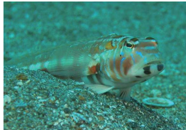
ボクも持ち帰ってみてね