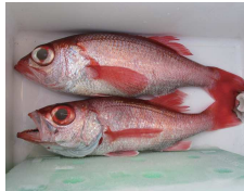
アカはホタルジャコ科