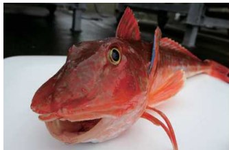
恐竜を連想させます

ホウボウは暗緑色ベースにブルーの縁取りと斑紋多数、カナガシラは一面赤橙色、オニカナガシラは橙と緑のグラデーションで内側黒斑紋に青の縁取り、カナドは緑ベースの内側濃紺で赤い縁取りと（とってもややこしいです）、それぞれ違うので区別ができますが、種類が多すぎて一覧表がほしいところです。中でも一番間違えやすいのがトゲカナガシラ。明緑ベースに青い縁取りと斑紋多数に不規則な縞模様まで入って一番ハデです。ツラ構えも身体つきもボディの模様にも皆ビミョーな違いはありますが、胸ビレの色模様で覚えると瞭然だし面白いと思います。元々ヒラメなどの外道として釣られていた魚ですが、食味がいいため「うれしい外道」として名が知られ、今では人気のターゲットに出世しました。顔だけ見ると美味しそうに見えませんが、とっても上品で美味しい魚なんです。まずはやっぱり刺身でいただきたいですね。旨み、食感ともにベリーグッドで、カルパッチョなどでも美味しく頂けます。刺身だけならやや厚めに切った方がモチモチ感が楽しめるでしょう。頭がやたら大きく身が先細りと歩留まりが悪い魚ですが、ダシが出るので汁物や煮物もお勧めです。火を通すと身が硬くなってしまっているので焼き物には向かないかも知れません。