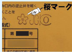
桜マークの付いているものを

2018 年から小型船舶の全ての乗船者にライフジャケットの着用義務がありますが、今年の 2 月 1 日からは未着用者があった場合、当該船の船長に違反点数 2 点が付され再教育講習を受けなければならないとのこと。さらに違反点数が累積すると最大で 6 ヶ月の免許停止という行政処分が下り、無免許は 100 万円以下の罰金、免許証不携帯は 10 万円以下の過料など罰則が厳しくなってきました。出船前に必ずチェックして下さい。