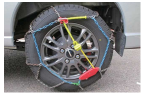
一度は試装をしましょう

寒い日が続いています。3月までは雪も心配ですね。過去には秋谷港でも20センチほどの積雪を記録しています。お車の冬タイヤは万全ですか？場所がら一年中夏タイヤという方も少なくないと思いますが、タイヤチェーンは携行した方がいいでしょう。天気予報で「明日は南岸低気圧が通過し、」といったら降雪の可能性アリです。北国育ちの人ならチェーンの装着も慣れていますが、首都圏の人は不慣れなので事前に練習しましょう。船舶施設も平日ならば空いているので練習するにはもってこいです。ジャッキもありますので、必要な方はお声掛けください。