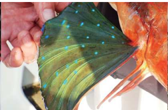
ホウボウの胸ヒレ