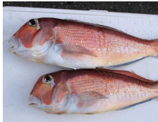
立派なアマダイでした