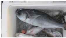
きれいな白身のメダイ

アオモノは今一つですがソコモノが充実しています。ミンコタの普及で 300メートル付近を狙う方が増えてきました。ただシーアンカーで頑張る艇もあり脱帽です。キロ超えアマダイは迫力ですね。美味しそうです。ハタは種類が多く判別も難しいですね。画像は超美味といわれるコモンハタです。クロムツはムツ科、アカムツはホタルジャコ科、似ているけど全く違う種なんです。