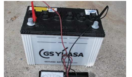
寒い時期は特に注意

毎年のことですがこの時期心配なのがバッテリー。2月と8月にダウンすることが多く、極端な寒さと暑さに弱いのです。出船前なら交換するなど対策可能ですが、沖合でトラブルったらアウトです。そんな時はBANに電話するしかありません。ミンコタ装着されている方は複数のバッテリーをお持ちなので、一度に交換すると痛い出費となります。こまめなチェックで早めの対策を心がけましょう。取付年月日を記しておく目安になります。「充電すればまだいけるかな？」という方は船舶事務所にテスターがあるので電圧程度なら計れます。気になる方はお申し出ください。