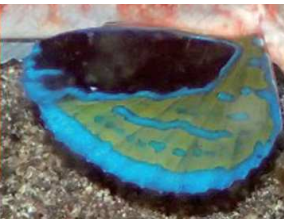
トゲカナガシラの胸ヒレ