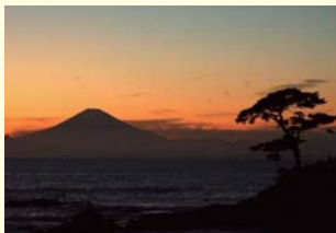
立石海岸からの夕景