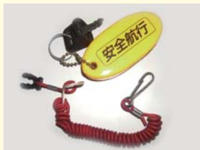
緊急停止スイッチのフックは衣類に装着しましょう