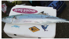
今後も楽しみです

水温が下がり釣物が豊富になりました。そろそろアマダイも狙いたいですね。カワハギは順調でキモも食べ頃です。マダイとスマ、イサキで刺身の盛り合わせができますね。ダイナダかワラサか、呼名に悩むところです。ホウボウやハタも美味しい季節ですね。珍しいところでキジハタ、斑紋が美しい。他にアジ、ソウダ、カイワリ、フエフキ、イトヨリ、スミ&アオリイカなどが釣れています。