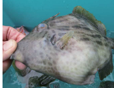
ワラサかダイナダか