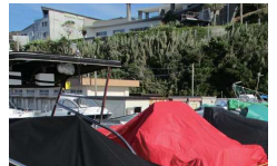
塩害対策にはカバー

西高東低の気圧配置になると、いわゆる冬の季節風が吹き荒れます。何日も続くと天然の塩が施設フェンスやら保管艇のボディやらにびっしりと。洗艇必至となりますが、せめてキャビンとエンジン部だけでもカバーを施し、塩の付着を避けたいですね。台風の暴風のときはカバーが災いすることもあります。季節風には有効です。オリジナル製品なら言うことありませんが、ブルーシートでも充分役目は果たします。これから春まで冬眠を考えている方もそうでない方もぜひ実行して下さい。ついでにバッテリーも外し、ご自宅で充電できれば春の目覚めもすっきりです。