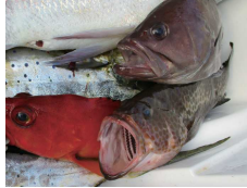
食べ頃サイズのイサキ