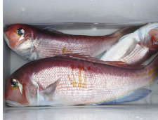
金銀銅を独占です