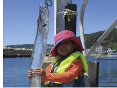
さわっても切れない？