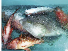
圧巻の尺ハギでした