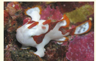
歌舞伎役者のような種類も

もともとアンコウの仲間、額からのびる疑似餌のようなものを使って獲物をおびき寄せて捕食します。ただアンコウに比べて身体が小さく5センチほどしかないので、食用にはなりません。擬態が得意でダイバーに超人気です。