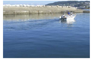
引き波ゼロの見本

港内最徐行は秋谷に限らず基本です。しかし稀に元気よく入港される方をお見かけします。おそらくご自分では徐行されていると思われそうですが、目安としてまず振り返って自艇の引き波を見てください。この波が港内の岸壁に跳ね返るようではマズイのです。着岸アプローチは前進とニュートラルを交互にギアチェンジして後進に入れなくても止まれる速度がベスト。ただし向かい風(秋谷では南西風)が強い時は、風に押されない程度にスロットルを開けてください。万一、左舷側に流され過ぎたら、無理に右舷側にハンドルを向けず、一旦充分に後進してから風上に向かって再アプローチして下さい。