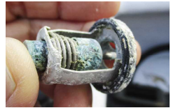
塩害みしたサーモスタット

インペラの重要さはこのコーナーでも何度か取り上げましたが、インペラと同じくらい重要なパーツのサーモスタット。エンジン内の冷却水をコントロールし、水温を適正に保ちます。当然いつも海水にさらされているので塩害を受けます。故障するとオーバーヒートの原因になるため定期交換は必須です。帰港後の水路の水通し作業でかなり塩害を軽減できますが、それでも年に一度は交換したいところです。作業にあたっては新品部品は勿論のこと、パッキンやガスケットも交換して下さい。取付ネジが折れる場合があるので、こちらも用意した方がいいでしょう。心配な方は業者さんにお問い合わせください。