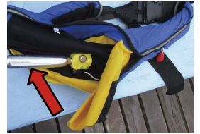
ポンベの定期点検を

ボーターの必需品ライフジャケット、色々なタイプがあります。浮力の強いウレタンベストが安心ですが、夏場は暑くて、、、少々高額ですが、自動膨張式のコンパクトなモデルがかさばらず動きやすい上に涼しくて人気ですね。誤って落水しても自動で膨らみ浮力を確保するので安心です。しかし本当に大丈夫でしょうか?艇同様に点検が必要なの言うまでもありません。膨張させるためのガスポンベを点検して下さい。うっかり水に触れて破裂してしまったり、サビて穴が開いてしまったりして肝心の時に役に立たないなんてことも。船室に置きっぱなしの方は要注意です。