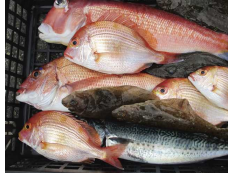
アカ魚バラエティセット