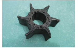
定期交換しましょう

先日、船外機暖気運転中に突然検水が出なくなりました。おかしいと思ったらインペラの羽根が1枚欠損しており、その破片が水路をふさいでいました。インペラゴムの経年劣化に加え、給水の不十分さが原因とみられます。欠損していない他の羽根もひび割れエッジ部分が摩耗していました。日頃エンジン始動の際は給水レシーバを利用していますが、できれば大きなバケツ等で十分な給水を行った方がいいですね。給水レシーバを利用する場合は、しっかりと挟むことが重要です。水栓もしっかり開けましょう。ゴム製品なので定期交換は必須です。欠損した破片は忘れずに取り除きましょう。