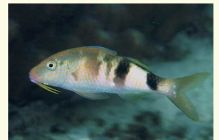
オジサン仲間は多いです

【オジサン】随分なネーミングですね。名前の由来は長く伸びたヒゲ、真正面から見た顔つきがおじさんに似ているからとか。ヒメジ科の魚でホウライヒメジとかヨメヒメジとか種類がたくさんあり、全てをオジサンと呼ぶ地方もありますが、第2背びれと尾びれの付根付近に黒横帯があるものが正しきオジサンの姿です。じつはオジサン、こう見えても沖縄など南方系なんです。なので秋谷で見られるものはけっこうレアなんです。