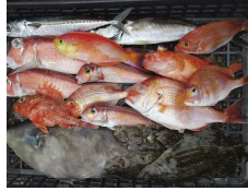
どれから食べようか