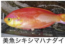
美魚シキシマハナダイ

夏の海とは思えないアカい魚が釣れてます。アマダイは通年釣れますが、キロ超えはなかなかのものです。マダイもグッドサイズ。他にレンコダイ、オニ、アヤメ、ウマヅラ、カレイ、アジ、サバと魚屋さんみたいでした。右上の美しい魚はシキシマハナダイ。水深 50m 以深に生息するフォトダイバー憧れの魚です。アカい魚もいいですが、そろそろアオイ魚も釣りたいですね。