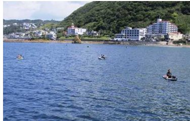
秋谷港口は危険がいっぱい

このようなエリアは全国に無数にあると思われ、秋谷もかなりこの状況に近い海岸といえます。夏になると遊泳者やSUP、カヤックや水上バイクなどで海上はかなり賑やかになります。そしてこのエリアに漁港口が隣接しており、漁船や当施設の保管艇が出入りしているのです。大きな漁船からは直近に浮かぶ遊泳者はほとんど見えません。プレジャーボートにしてもカヤックは発見できても遊泳者は発見しづらいのです。また秋谷海岸は海水浴場ではないので、海の家も監視員もいません。私たち施設職員も漁港口で遊泳者を見かけた時は、放送等で速やかな移動を呼びかけますが、完全な防止策には至っていません。出港される時は、徐行しながら各部の点検、装備の点検、そして海上の様子をチェックを行われる皆さんも、帰港時は少々注意力が低下してしまうこともあるでしょう。長時間海上で過ごされてお疲れのことと存じますが、最後の最後まで気を抜かないで下さい。秋谷にご来場されるすべての方が、楽しい思い出を持ち帰れるよう、一人一人の事故防止意識を高めることが大切です。