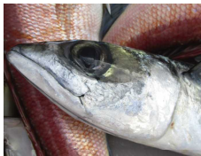
サバの季節になりました