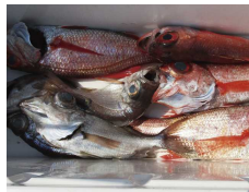
アカ&シロのムツセット