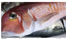
夏でも釣れます、アマダイ

アジやサバなどアオモノが釣れるようになりました。サバは昨シーズン不調でしたが、今シーズンは「サバの猛攻」があるようです。アカムツやアマダイなどソコモノも健在、浅場ではキスが好調と、様々な釣スタイルに対応可能な海になってきました。現在、港内にサバ幼魚の大群がいますが、夏過ぎには大きく育つのでしょうか。イナダやシラ、カツオも近い？