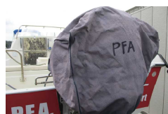
カバーには船名を記入

船体の劣化防止に重要なカバーやシート。普段は紫外線や潮風を防いでくれる頼もしいアイテムです。しかし台風など暴風の時、一転して凶器に変わることもあります。ぴったりフィットし確実に取り付いていないと、わずかな隙間から入り込んだ風にあおられ、とばされてしまうばかりか、パタパタと暴れたカバーでウィンドウが叩かれて割れてしまったりと、災いを起こすこともしばしば。これから台風シーズンを迎えるにあたり、今一度、カバーのほつれや留具の点検を行って下さい。また汎用のカバーやエンジンフードには船名を書いて下さい。ブルーシート等をご使用の場合は、風が抜けるような処置をお願いします。