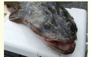
コチは平頭に大きな口

「キスを狙ったけどメゴチしか釣れなかったよ」。よく聞きますが、釣魚のいわゆるメゴチとは、実はメゴチではなくネズツボ科のネズミゴチやトビヌメリ。メゴチという種の魚は実際に存在しますが、こちらはこちらでメゴチと間違えられます。そしてメゴチという標準和名はなく、正式には「コチ」です。・・・ややこしいですよええ。判別方法としてコチ科は大よそ頭がスコップのように平たく口が大きい。対してネズツボはおちょぼ口です。