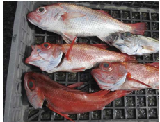
アカムツ釣れてます