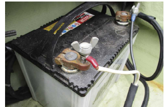
手締めでは不十分です

船外機でも船内外機でもバッテリーの重要さは皆さんご存知だと思います。しかしターミナル取付け方法もかなり重要なことはご存知でしょうか。よく見かけるのが蝶ネジで固定する場合に、指で簡単に締めるだけのパターン。振動を伴う航行中はネジがゆるむ場合が多く、接触不良を起こす可能性が高いのです。ただゆるむだけならまだしも、ショートしてスパークを起こすと鉛でできたターミナルは簡単に溶けてしまいます。周囲に可燃物があれば火事になります。締めつけは工具を使って確実にいきましょう。