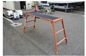
事務所に貸出し用あります

艇のメンテに脚立は欠かせませんが、とここでその脚立、大丈夫でしょうか。中にはかなりくたびれたモノもあり、少々心配です。ほとんどは本体がアルミ製で各パーツがリベットで固定されます。リベットが鉄製ならば老朽具合を目視できますが、アルミ製だと確認しづらく、体重をかけた時に破損する可能性もあります。若いころは何でもなかったのに、加齢によって俊敏な動きができなくなった身体にとっさの対応ができるでしょうか。いつも艇のそばに置きっぱなしなので塩害による腐食も早まっています。帰港後に水洗いするとともに、定期交換をされた方がいいでしょう。