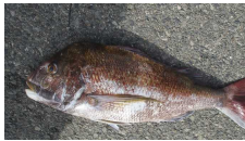
3キロオーバーの老成魚

アカムツが好調です。同時にシロムツも釣れて紅白でおめでたいですね。ようやくキスも釣れだし今後が楽しみです。アジはまずまずの形で刺身、塩焼、フライにOK！ すごいマダイが釣れました。天然モノと思われるのですが、年季の入った体表からかなりの老成魚でしょうか。他にホウボウやサバ、アオリイカなどが釣れてます。