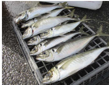
アジの季節になりました