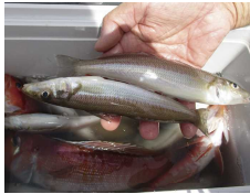
グッドサイズのキス