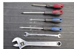
正しい使い方があります

日頃のメンテや緊急のトラブル対処に工具は欠かせません。しかしながら「えーと、プライヤーはどこだっけ？」と探したら、サビサビで動かない・・・なんてことも。鉄でできている工具にとって塩水は厳禁。船室など水のかからない場所に保管しましょう。また必要最低限の工具は携帯したいですね。自分の艇にはどの工具が必要か、リストを作っておくといいかも知れません。スパナやモンキーは使用方向があります。正しく使わないとネジをなめることになるので要注意です。ドライバーもスクリューのサイズに合わせてプラスマイナス最低2種類ずつ必要です。エンジンがどうしても動かない時は・・・やっぱりハンマーですか？