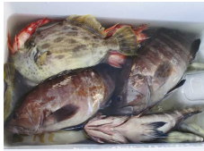
こたつで鍋がいいです