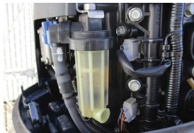
フィルターも清掃しましょう

ところでガソリンの賞味期限、すなわち有効期限はどの程度なのでしょう。ガソリンは液体ですが、液体自体は燃えません。ガソリンから揮発するガスが燃えるのです。したがって揮発（気化）性能が悪くなるといけません。揮発性能を悪くする原因として酸化が考えられます。ガソリンに含まれるアルケンというエチレン系炭化水素が空気中の酸素によって酸化し、蟻酸や酢酸に変化します。これによって赤オレンジ色に着色処理されたガソリンが褐色に変色し、同時に刺激臭を生み出します。さらにガソリン中の揮発成分が失われ、流動性が悪化してドロドロになってきます。こうなると燃焼しないばかりか、インジェクターやキャブレターのノズルやバルブを固着させるため、エンジンはかからなくなります。ガソリンの劣化度合いは保存の仕方で大きく変わります。空気へのさらされ具合や周辺の温度、湿度等の条件が悪いと、3ヶ月～半年程度で劣化します。ガソリンタンクのキャップを開けた時に、すえたような刺激臭があったら、劣化を疑いましょう。いずれにしても、長期間使用しなかった船外機は、タンク内のガソリンを入れ替えた方が良いでしょう。ただし、どんなに劣化しても引火性の強い危険物に変わりはないので、抜き取った燃料はガソリンスタンド等に処理を依頼してください。