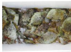
肝和えが食べた〜い