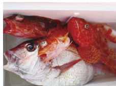
今夜はご馳走だー