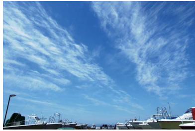
雲の形や動きをチェック

いい風の日に出船してのんびり釣りを楽しむ・・・。ボーターにとって最高の休日ですね。これで本命が釣れば言うことありません。ただ天気はもちろん、海況も朝から夕方まで同じということはまずありません。時間経過とともに海況が好転する状況ならば問題ありませんが、その逆だったら・・・。釣りに集中するあまり、気がついたら白波が立っていた、なんてことも。20フィート足らずのプレジャーボートでは波立つ海でまともに操船できません。海況の変化を先読みして、波立つ前に帰港されることが、良い休日の締めくくりになると思います。秋谷スタッフも天気予報をチェックしたり、漁師さんに尋ねたりしますが、大切なのは海況が変化する前の予兆を見落とさないことです。漁師さんは常に雲の動きに目を配り、沖に浮かぶ船の様子や水平線の見え方、海面の色などを見て、「(風が)吹いてくるな・・・」と、判断します。ずいぶん前のことですが、行楽日和の日曜日の昼過ぎに、秋谷の漁師さんが佐島漁港に燃料補給に出かけようと、ふと沖に目をやったところ「ヤバイ!吹いてくる・・・」「出かけるのは止めよう。」と言って帰ってしまいました。その時はそれほど荒れるような海況には見えませんでした。それから30分もしない内に風が吹いてきて、海は白波が立ち、状況が急変しました。5艇以上が出船中で、当然、沖合も釣りを楽しむ状況ではなくなったのでしょうか。帰港を知らせる電話が鳴りまくり、スタッフは上架の準備に追われました。後で漁師さんに聞いたところ、「水平線の色合いが黒くなった。黒く見えるのは波が立っているからだ。雲の動きも速くなっていたからね。」「オレたちはいつも雲や水平線を見ているんだ。」さすがは海のプロですね。予報で風向きや風力、波高をチェックするのは当然ですが、それ以外に気にして頂きたいのが天気図です。等圧線の間隔や推移の他に前線の位置などは必須です。付近を前線が通過する予報であれば要注意、場合によっては出船を中止した方がいいでしょう。