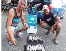
マルイカ釣れました〜