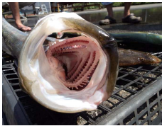
迫力のスズキの口