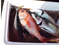
アカムツとゴマサバ