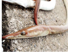
目つきやや悪しウミヘビ