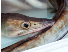
キリッと目のハモ