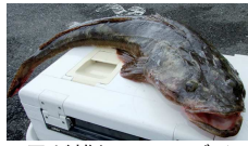
目が離れてるマゴチ

キスを中心に砂地ソコモノが多いですね。コチが釣れています。本命はマゴチと思われませんが、けっこう多いのがイネゴチ。判別の仕方は形、ガラ、そして目。両目の離れ具合だけでなく黒目の模様が違います。ちょっと珍しくハモ。ハモはウナギの仲間ですが、ありがたい外道はダイナンウミヘビ。判別はシッポ。ヘビ類は尾びれがありません。