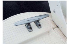
強い荷重がかかります

船上で過ごすのが気持ちいい季節ですね。まったりしていると予期せぬ波に思わずクリートをつかんだら…。クリートは船をロープ固定するときのパーツですが、アルミ製でもろくなったものや取付基部の舷がひび割れたものを見かけます。うかつに体重をかけたら、ケガをしたりクリートそのものが取れてしまったりなんてことも。ステンレス製に交換したり取付位置を変えたりしましょう。取付けの際は大きな荷重に耐えられるよう舷の内側からプレートをあてて、ボルトナットで固定して下さい。木ネジやナッターは破損する可能性が高くNGです。古いクリートはあえて外す必要はないと思いますが、外す場合は穴をきちんと埋めましょう。