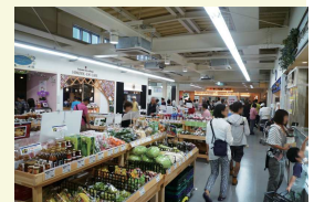
地物いろいろ揃います

オープンから3年半、賑わいを見せる道の駅葉山ステーション。葉山の美味がいろいろ販売されていて、秋谷帰りにちょっと立ち寄るのもいいですね。様々なスイーツやパン、地野菜、海産物、お弁当やワンコインの海鮮丼など、あれもこれも欲しくなります。コロッケで有名な肉屋さんもあり葉山牛も買えますが、筆者のお気に入りにはマカロニサラダ、風味抜群でイチ押しです。