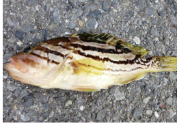
Noイサキ、イヤゴハタ