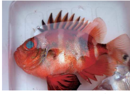
目デカ！クルマダイ