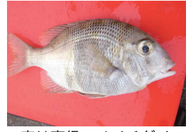
実は高級、メイチダイ