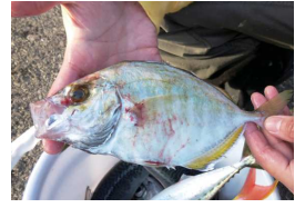
アジの仲間、カイワリ