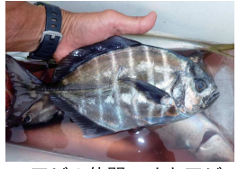
アジの仲間、オキアジ