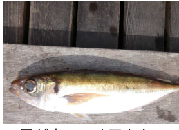
尾が赤い、オアカムロ