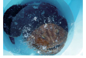
アンコウ by 紋四郎丸