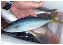
美スリム、ツムブリ