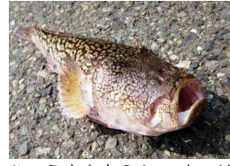
ひょうぎんなミシマオコゼ