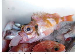
美味白身、パラメヌケ