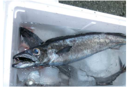
スマヤキことクロシピカマス