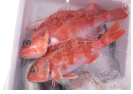
ノドグロ、ユメカサゴ