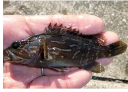
クエの幼魚（漁港内）