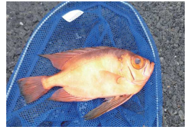
目デカ！チカメキントキ