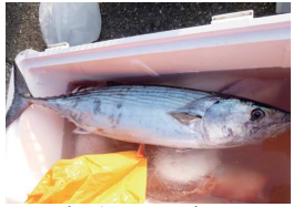
歯があるハガツオ