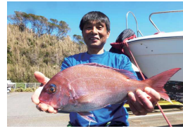
いい仕事をしましたよ