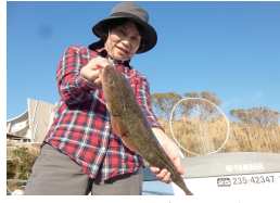
今夜のおかずはマゴチ