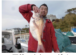
天然ですよ～マダイ