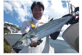
刺身と西京焼きだ～