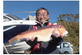
オしだって! アマダイ