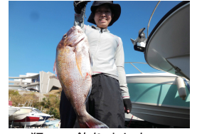
狙って釣りました～