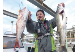
マダイとスズキゲットオ