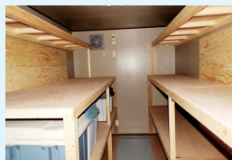
新しい利用者倉庫の中

台風被害でご利用できなかった利用者倉庫が復活しました。ただ少々容量不足のため、隣にあるポートキャリア車庫の一部を倉庫として利用します。お一人当たりのスペースは、以前の倉庫の時と変わりませんが、大きなもの(竿やタモ網、脚立等)は収納できませんので、お持ち帰りになるか、艇内に保管して下さい。燃料やオイルなど危険物は収納できませんのでご注意ください。通路スペースがやや狭く、ご不便をお掛けしますが、ご理解の程、お願い致します。