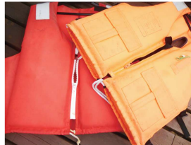
ファスナーをチェック

まずはお湯につけます。熱湯も可ですが、できれば60～70度くらいの湯に漬けおきましょう。固まった塩分を分解してくれます。そして固着といえばCRCなどの潤滑剤。ワンスプレーで劇的に改善するイメージですが、やらないよりはマシくらいのもりで臨んで下さい。一応、浸透させましょう。ファスナーの金具とスライダの塩気が無くなったら、ヒモを持ってゆっくりと前後に動かしましょう。少しでも動きだしたらチャンス。潤滑剤を再びスプレーして、あせらずじっくりと。市販の塩噛み解消スプレーもありますが、手順は同じです。塩噛みは予防が大切。洗うのはもちろんですが、効果的なのはファスナースライダーにロウを塗ること。普通のロウでもいいですし、ダイビングショップで販売されているドライスーツ用のスティックロウが塗りやすくおススメです。