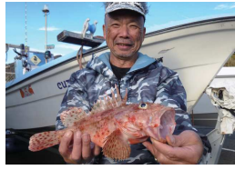
トゲはコワイよオニカサゴ