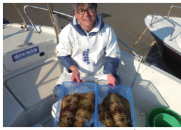
アオリイカ・好き