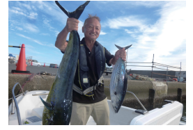
夏だね! シイラとカツオ