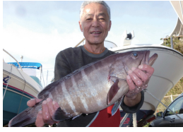
マハタはやっぱ鍋だね