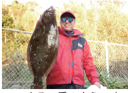
まるで盾のようです