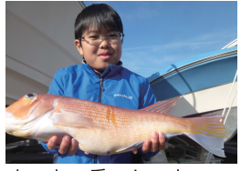
お・お・重いんです・・・