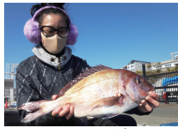
I Love マダイ