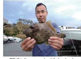
肝和えていただきます