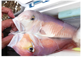
めでタイ? 紅白アマ