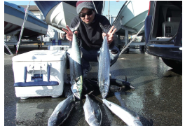
サ・ワ・ラ・釣・り・まし・た