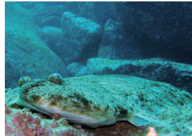
いつも上を見上げているんです

ヒラメは獲物を一気に飲み込むのではなく、ジワジワと口の中に取り込むので、焦りは大敵です。ヒラメ 40 というくらいなので、アタリを確認してから 40 数えてから合わせた方がいいでしょう。サイズにもよりますが、やっぱり刺身で頂きたいですね。前述したようにヒラメはヒレの付け根、縁側と呼ばれる部位の筋肉が非常に発達しているため、その食感をぜひ味わって下さい。