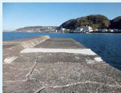
立入規制を解除しました

昨年の台風で破損した防波堤先端部の工事が終了し、危険性が軽減されたため、立入規制を解除しました。ただ波消しブロックは手つかずで崩れる可能性が高いことから立入禁止です。防波堤は段差などでつまづきやすく、落水すると上がるのが困難です。万一を考え、救命浮環を設置していますが、落水に気づく人がいなければ、何にもなりません。釣等をされる方にはライフジャケットの着用を呼びかけているので、ご協力をお願い致します。