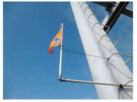
着岸の参考にして下さい

保管艇ご利用者からご提案を頂き、棧橋に風向旗を付けてみました。帰港アプローチの際にご参考にして頂ければと思います。これからの時期は午後には南風が強まる事が多く、船首が左に流されやすくなるので、こまめなハンドル修正が必要です。万が一、左に向きすぎたら、時計回りに修正しようとしてもかかないません。漁船エリアに流されてしまうので、大きく後退するか、反時計回りに修正して下さい。場合によっては一度港外に出て再アプローチした方が良いかも知れません。アプローチ前にもう一度、釣竿やミンコタが船外に出ていないか確認をお願いいたします。