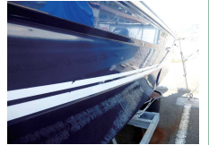
ワックスで光沢復活

紫外線が強くなる時期です。FRPで出来ている船体にとって紫外線は大敵です。塩害も困りますが、紫外線は知らないうちにFRPの表面にダメージを与えひび割れの原因になります。出船されない休日や、出船しようと思ったけど海が悪くて見合わせた時などに、思い切ってワックス掛けをしちゃいましょう。面倒でも3ヶ月に一回行くと表面のツヤも復活するし、保存状態が格段にアップします。一度にやろうとするとイヤになるので、少しづつ行うのがコツです。すでに荒れてしまった表面にはコンパウンドで磨くと持ち直しますが、やはり普段からのお手入れが大事です。きれいになった愛艇を見るとまた惚れなおしますよ。