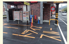
便利なドライブスルー

新型コロナのせいで自粛を求められる中、困るのが食事という方も少なくありません。休業するレストランや時短営業する外食産業など、今まで当たり前利用してきた飲食ができなくなっています。逆に増えたのがテイクアウトサービス。3密が少しでも軽減されると、新採用するお店も。さらに効果的なのがドライブスルー。牛丼やハンバーガーなど、安くて手軽な食べ物が人気です。家食に飽きたらいかがでしょうか。