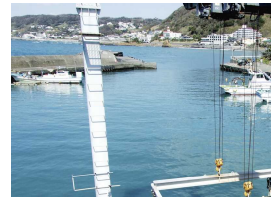
余裕を持って後進を

離着岸の際の注意事項です。無風時は問題ないと思われませんが、いつもそうとは限りません。後進で離岸するとき、背側から強い北風を受けると艇が押し戻されます。気をつけたいのが反転時、風を船横から受けるため、流されやすくなります。低速だと舵もきかないので流されるままに。最悪、係留漁船などに接触することもありますので注意が必要です。では、どうすればよいか。流されることを想定して、無風時より長めに後進してから反転してください。南風が強い時は、離岸よりも着岸時が要注意。流されないよう棧橋手前ギリギリまで、風に向かって微速前進のアプローチをして下さい。