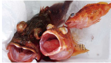
深場のカサゴは旨い

アマダイは一段落？最近ではカサゴやメバルがおススメです。季節を問わず美味しい魚です。深さによっていろんな種類があって面白いですね。ようやくアオリイカの釣果がありました。画像は1キロ超えで満足のものでした。マダイはこれからノッコミを迎えます。サワラは運とタイミングが大事ですが、当たった時の喜びはひとしおです。