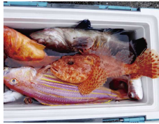
美味しい詰め合わせ