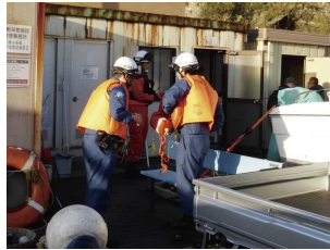
任務にあたる海上保安官

通報にあたっては、まず「何が起きたか(遭難・火災・密漁等)」、「どこで起きたか(地名・付近に見えるもの等)」、「誰が通報しているか(氏名と当事者が目撃者か等)」を正確に伝えることが大切です。なお携帯電話からの通報であれば「緊急通報位置情報システム」によって位置情報が送信されるので、GPS機能はONにしておきましょう。なお、生命の危険を伴わないエンジントラブルや操舵トラブルなどは、まずボートレスキューサービスBANに救助要請するのが一番なのはいうまでもありません。