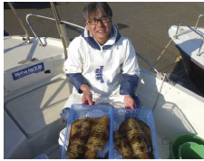
ようやくアオリイカ