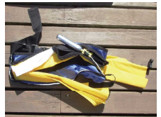
ポンベも定期点検を

ライフジャケットの点検をしましょう。行楽の季節をむかえ、ゲストをお招きして出船される機会もあると思います。さあ出船、いざライフジャケットを・・・と思ったらファスナーが閉まらない、いやその前に開かない、なんてことも。原因は塩噛み。船室に放置されたままだとうなります。天気の良い日に取り出して干しましょう。ファスナー部は水洗いしてシリコンスプレーすると塩噛み予防になります。保存時はファスナーを閉めない方がいいでしょう。自動拡張式はポンベの点検をしましょう。たまにガスが抜けていることも。サビのひどいものは交換しましょう。命を守るアイテムなので点検必須です。