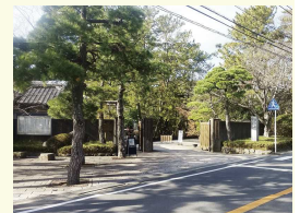
葉山しおさい公園入口

【葉山しおさい公園】葉山御用邸に隣接し、以前は附属邸として皇室の方にご利用されていました。5500坪の広大な敷地内には、博物館をはじめ休憩茶処や池、富士山に見える芝生広場や散策路があり、ゆったりと過ごすことができます。博物館には昭和天皇が採取された魚貝類や海藻類、使用された漁具、ヨットの他、特大タカアシガニなどが展示されています。入園料おとな300円。月曜休園、駐車場あり20台