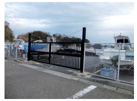
防犯対策をしましょう

2020年1月早々、佐島漁港において、小型漁船の船外機が窃盗未遂に遭う事件が起きました。2人組の犯人が船揚げ場にあった漁船から取り外して盗もうとしたもので、たまたま漁から帰港され、現場を目撃した漁師さんからの連絡を受けた船の所有者が取り押さえた、ということでした。夜間の犯行でしたが、近隣の漁港でも同じような被害があることから、警察では余罪を調べているとのことです。時間外の秋谷施設は立入禁止地区になっているので、他地区に比べるとリスクは少ないですが、平成30年11月に保管艇の備品が盗難被害に遭っているため、施設を行うなど改めてご自身の艇および備品等の対策を心がけて頂きたいと存じます。