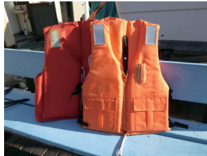
ライフジャケットは遊泳具ではありません

ライフジャケットは浮力を確保するために欠かせないアイテムですが、泳ぐためのものではありません。また厚着をすると最初は空気層によって浮力が発生しますが、水を含むと重くなり逆に抵抗となって、この状態で泳ぐことは無駄に体力を消耗することとなります。早く助けを呼びたいという気持ちはわかりますが、ボートにつかまり、体力を温存させて救助を待った方が良かったのではと悔やまれます。浮力の確保、体温低下の防止、そして連絡手段の確保が生存への絶対条件となります。ライフジャケットの着用は当然ですが、もしものために携帯電話を防水パックに入れて乗船されるよう心がけて下さい。