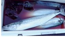
脂ののったサワラ

「春の魚」サワラ、運を味方にすれば爆釣となります。今冬はアマダイが安定して釣れました。しかもサイズがでかかった。2キロ近い大物が釣れた時は、みんな「いいなあ〜」。そしてマダイ。もうすぐノッコミの季節です。他にヒラメ、マハタ、オニカサゴなど、ゴージャスな海の幸がいっぱい。もう行くしかないですね。