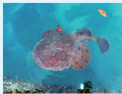
カメラ目線でした

1月中旬に秋谷港にアンコウが現れました。普段は深海の海底に棲む魚ですが、初春の産卵期になると浅場にやってきます。しかし港に出没するのは極めて珍しく、水面に顔を出す場面もありました。体長は70～80センチで大きい方だと思います。鼻先にエスカと呼ばれるアンテナのような疑似餌をぶらさげて獲物を誘いだし、近寄ったところを“パクッ”っとひと飲みします。秋谷でも昔は漁獲があったそうですが、今では超レアな魚になりました。