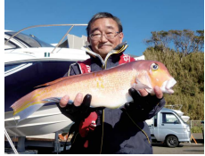
どうだい！アマダイ