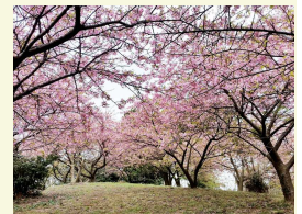
大楠山に咲く河津桜

暖冬にともない桜の開花時期も早くなってきた近頃です。ひと足早い桜として有名な河津桜。本家の伊豆河津は遠いですが、近場でも十分楽しめます。アクセスの良い三浦海岸駅付近の線路沿いや大井松田にある松田桜が有名です。そして昨年も紹介しましたが、秋谷からほど近い大楠山桜。本来はハイキングを楽しむ山ですが、平日ならお車でアクセスできるので、気軽にお花見が楽しめます。レジャーシートとお弁当を持ってひと足早い春を満喫しましょう。