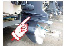
このあたりがインペラ室

船外機のインペラを交換する場合は、エンジン本体からドライブをはずす必要がありますが、たいへん重いので、通常はチルトアップした状態でを行います。この時、メインシャフトの脱着に注意しましょう。スプラインのかみ合わせを間違えるとギア操作に不具合が生じます。事前にギアを入れるなど位置決めを行って下さい。またインペラ室の分解に際しては、新品のガスケットやOリング等を準備した上で行いましょう。再利用すると思わぬトラブルを引き起こし、再分解するはめになります。組み付け時はボルトのネジにグリスを塗布して下さい。できればサーモスタットも同時に交換した方が良いでしょう。