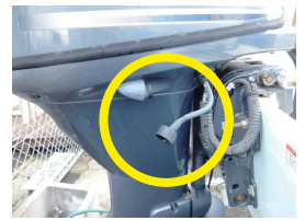
帰港後の水洗アダプター

インペラは、エンジンを冷やすために海水を冷却路に送るポンプの役目をするゴム製の羽根車です。ゴムの羽根が金属の壁とこすれあうために、吸い上げた海水で潤滑を行います。そのため、エンジン始動時は必ず給水を行う必要があります。まれに給水をせずに「ほんの少しだから・・・」と始動される方を見かけますが、これは止めた方がいいでしょう。インペラの羽根が傷つき、ひどい時は欠損してしまいます。めんどくでも大きめのバケツが専用フラッシャーを利用して始動しましょう。なお帰港後の水洗時にはフラッシャーではなく、付属の水洗アダプターをセットしてエンジンを始動せずに洗えるので、燃料節約になります。