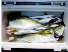
ワカシ以上イナダ未満