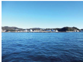
操縦中は見張りに集中

タンカーや大きな貨物船などはすぐに停止できません。停船行動をとってから何百メートルもかかります。ましてや波に遮られて見通しがきかない時もあるので、見張りは絶対に怠れません。グッドボーターであるご利用者の皆様におかれましては、このような行為はされていないと確信しておりますが、実際、貨物船の数倍スピードの出るプレジャーボートの操船において「よそ見」は命取りになる行為です。ましてやスマホを注視することは問題外の行為です。今後、自動車運転においても、ながらスマホは厳重な処罰の対象となりますので、絶対やめましょう。せっかく海にくり出したのだから、海の景色を堪能した方が楽しいですよ。