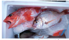
ユメカサゴ&アマダイ

寒さに負けずに頑張った人へのご褒美なのでしょう。美味しい魚が釣れてます。今シーズン目立つのがウッカリカサゴ。白斑紋が特徴です。ユメカサゴはクチグロと呼ばれる深場のカサゴです。アマダイやマハタはデバ地下で買ったかなり高そうですね。やはり釣人の特権ですね。これからはメバルやヒラメ、ホウボウが旬をむかえますよ。