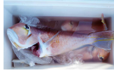
キコ超えアマダイ