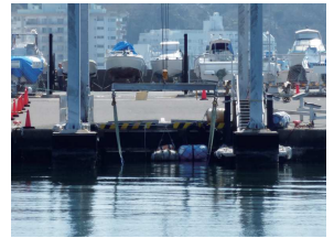
着岸は緊張します

停船の際にギアをリバースに入れなくてもいき足が止まればいうことはありませんが、実際にはなかなか難しいですね。高速道路から側道に入る際に、自分では十分に減速したつもりが、速度計を見るとかなり出ていたということがあると思います。停船も同じで、自分ではいき足が止まったと思って実際にはまだ慣性が働いて、スタッフがポートフックでいき足を止める場面が多々あります。これは事故につながる可能性が大きいので避けなければなりません。ポートフックはいき足を止める道具ではなく、止まった艇を引き寄せるための道具です。あらためてご自身の入港の仕方、停船の仕方をご検討してみてください。