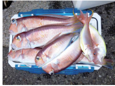
アマダイブラザーズ