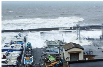
施設や漁港内は海と化します

皆様お忙しい中、施設に来て対策されるのは大変だと思いますが、大切な船のため、ぜひお願い致します。どうしても来られない方は、施設スタッフが対策することもありますので、対策ロープをデッキに出しておいて下さい。ロープはあるほど助かります。皆で力を合わせ、今年の台風を乗り切りましょう。