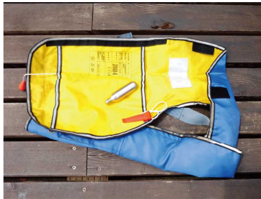
反射テープ・笛・ボンベ・認定印をチェック

本年2月から船室外にいる全ての乗船者は着用が義務付けられております。皆様におかれましては、この機会に今一度、ジャケットの点検をお願いします。乗船人数分あるか？ファスナーやバックルは機能するか？反射テープ、ホイッスルはあるか？認定マークは付いているか？自動膨張式はボンベが正常か？など、出船前に確認をお願い致します。