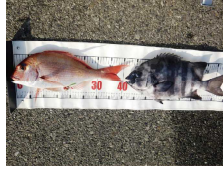
マダイ・イシダイ