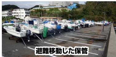
避難移動した保管