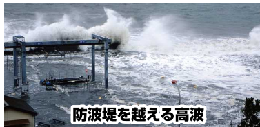
防波堤を越える高波