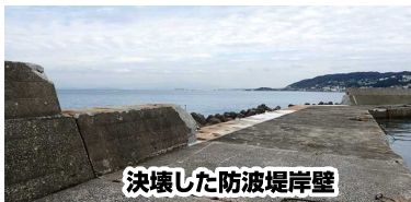
決壊した防波堤岸壁