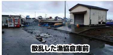
散乱した漁協倉庫前