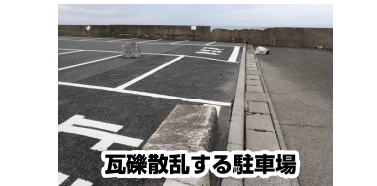
瓦礫散乱する駐車場