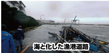
海と化した漁港道路