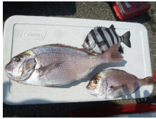
キロサイズのマダイ・イシダイ

ワカシ・サバ・マアジなどアオモノの釣果が聞けるようになりました。ソウダガツオや小シラの姿も見られ正に夏の花といった感じです。キハダを狙う方もおりますが、遊漁船が多いので、接近しないよう心がけて下さい。キスも好調、また、そろそろカワハギを狙っても良いと思います。この時期は、台風の影響でウネリが高いことがあるので、海況を事前にお問い合わせ下さい。