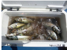
城ヶ島遠征の成果。マアジ