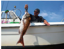
3キロ以上あるでしょうか ※写真の掲載に関してはご本人の許可をいただいております。