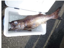
こちら大きい。クロムツ