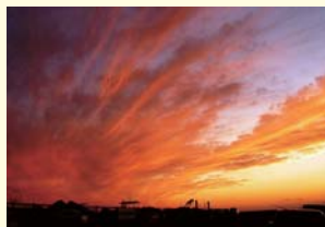
きれいな秋谷の夕焼け