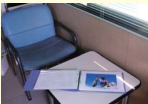
オーナー様釣果写真