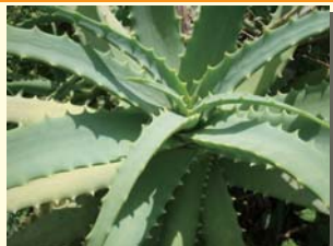
「医者いらず」のアロエの葉