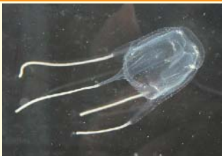
「電気クラゲ」アンドンクラゲ