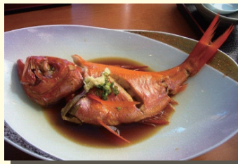
美味しそうなキンメの煮付け